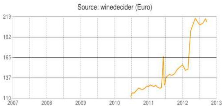
Evolution du cours du Château Pontet Canet 2009

Des prix remisés sur le catalogue CAVISSIMA pour acheter au-dessous des cours du marché.